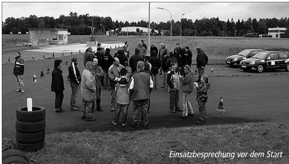
Einsatzbesprechung vor dem Start

Am 9. September fanden in der Fritz-Erler Kaserne in Rothwesten zwei Läufe zum ADAC Youngster Cup statt.