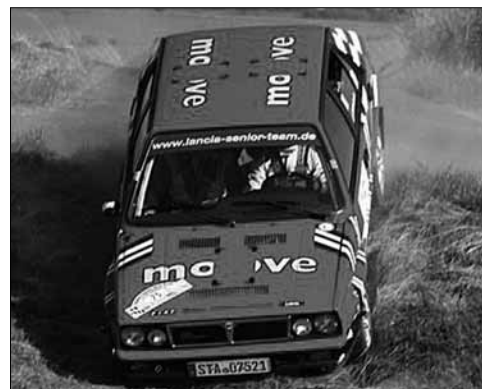
Bei der Eifel-Rallye belegten Stefan Burkart und Dieter Hawranke mit dem Lancia Integrale trotz einem Ausflug in die Wiese den 2. Platz in der Klasse.

Doch in den Prüfungen drei und vier verloren sie die Zeit, die im Endeffekt zum Gesamtsieg gefehlt hatte. Am Ende fehlten Stoschek/Hawranke im bildschönen 911 RSR trotz dreier Bestzeiten rund 22 Sekunden zu dem Zweitplatzierten Vayssettes im